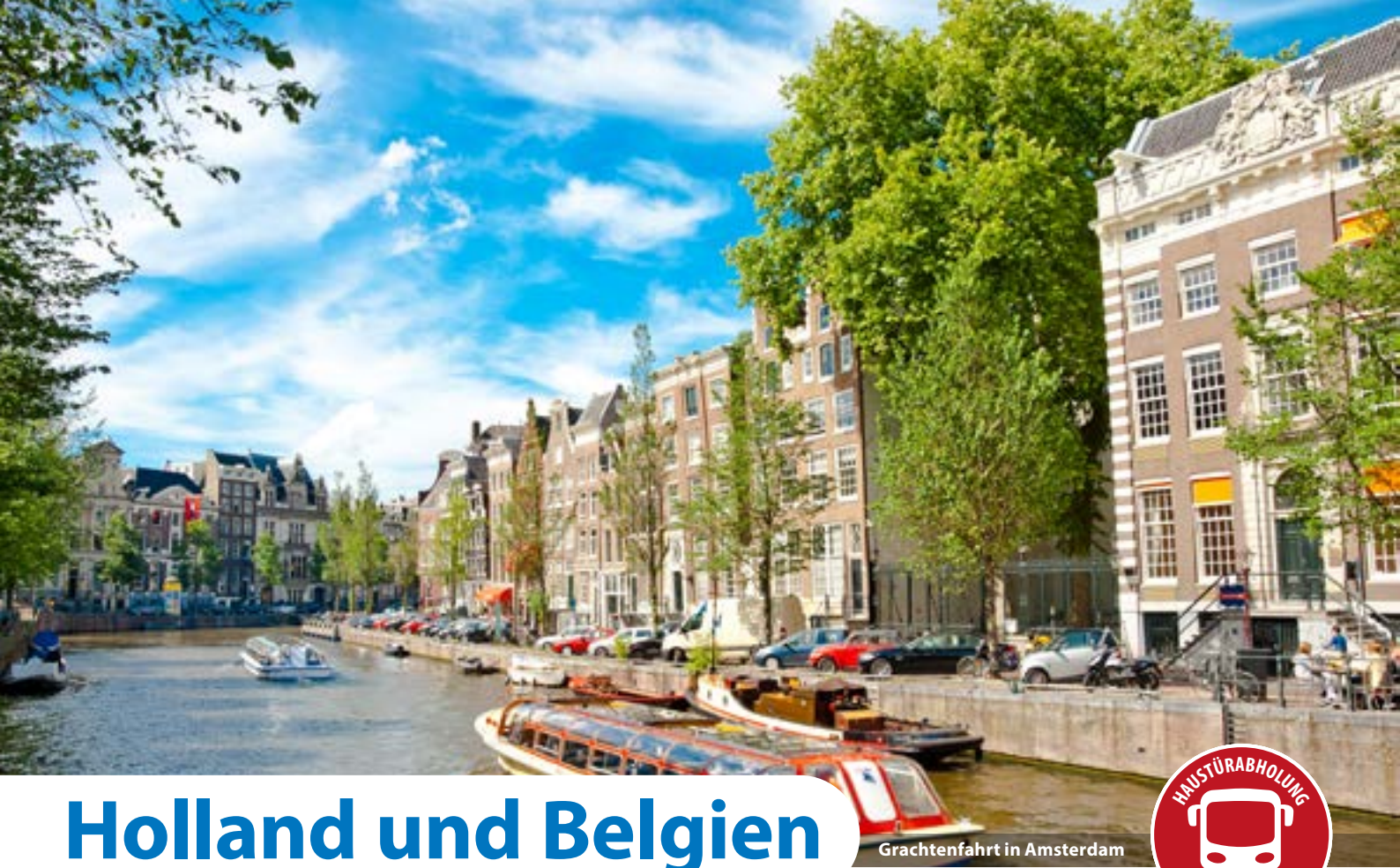
Grachtenfahrt in Amsterdam