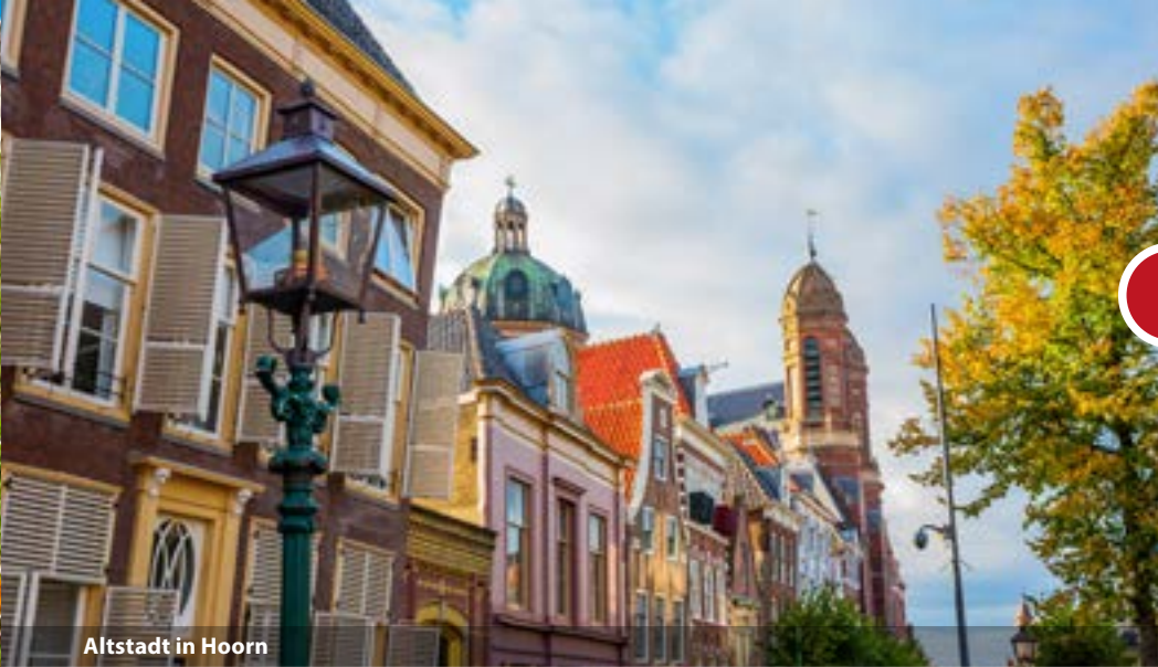
Altstadt in Hoorn