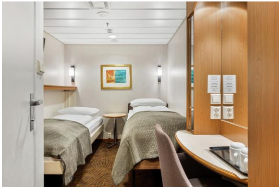
Beispiel Innenkabine MS Trollfjord