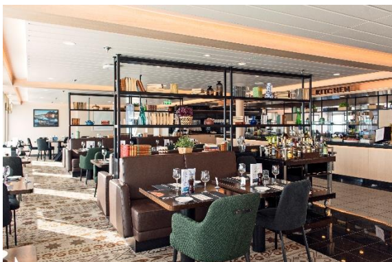
Torget Restaurant MS Polarlys

Bei der Einschiffung wird für Sie ein Bordkonto eröffnet, über das Ihre an Bord anfallenden Ausgaben abgewickelt werden. Sie bezahlen am Reiseende per Kreditkarte (empfohlen) oder bar. Bordwährung ist (Norwegische Kronen).