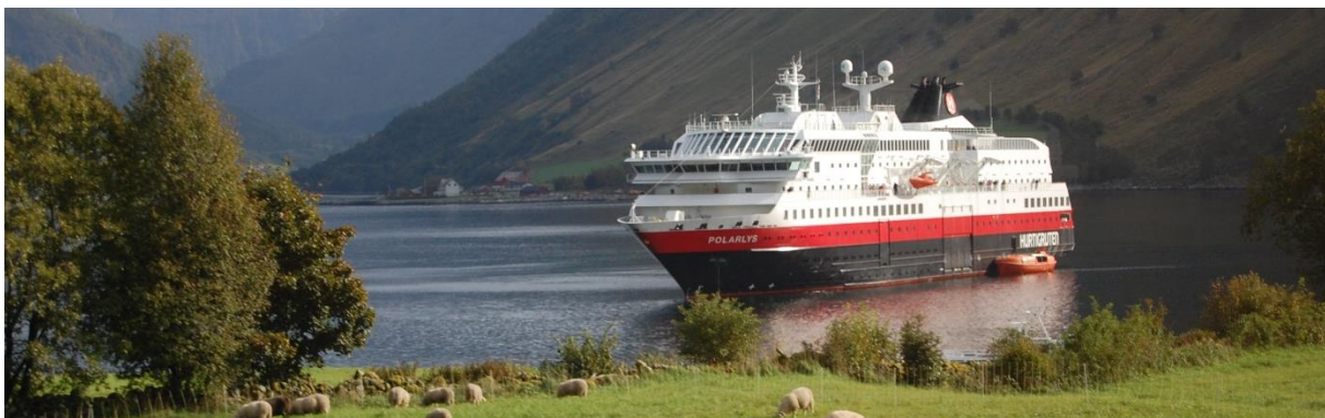
MS Polarlys