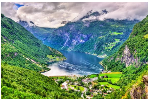
Blick zum Geirangerfjord