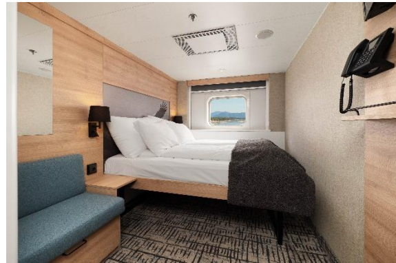
Beispiel Außenkabine Superior MS Polarlys